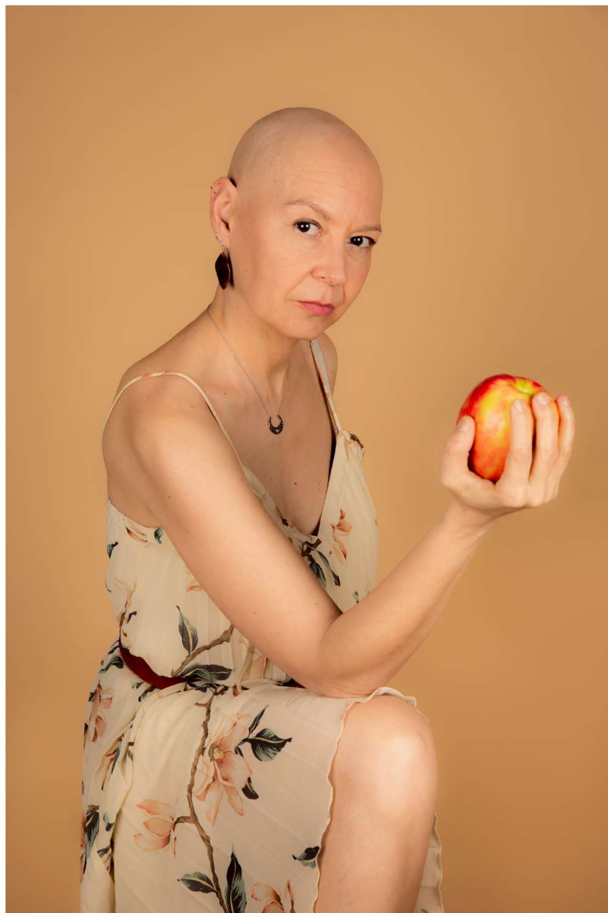
Fotografía - Nuria Zotes Sánchez